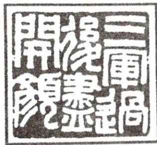
图2 三军过后尽开颜

材料三：印章以小巧之身，蕴藏了包括中国工艺、书法、文学等诸多领域的精华，中华民族的智慧与美都浓缩在这几寸见方的小小石材之中。如今，大量现代简易印章仍然被人们作为凭证而使用；另一方面，传统手工制作印章也因其审美价值不断地在人们手中流传，被欣赏、被赞叹。